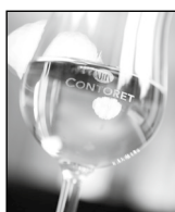
JÖNKÖPING vincontoret.se/jonkoping Tel 036-442 11 13