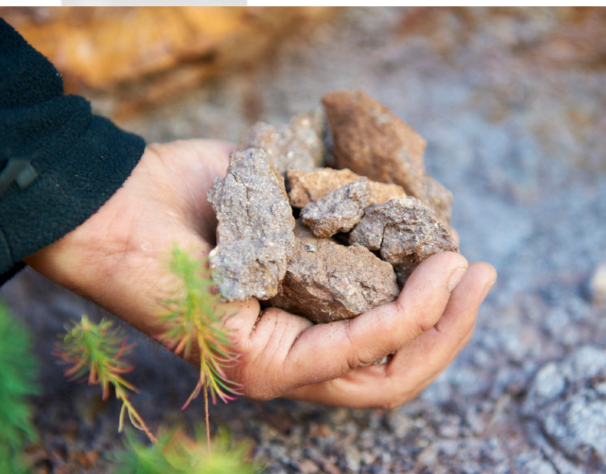
Det finns fler än 180 olika typer av jordar i Nahe, vilket gör att många olika sorters druvor trivs. Bilden visar vulkanisk porfyr i Schlossböckelheim.