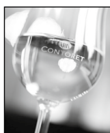
BORÅS vincontoret.se/boras Tel 033-180 98 13

Allt om utbudet på de olika orterna hittar du på www.vincontoret.se