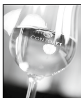
TIDAHOLM vincontoret.se/tidaholm Tel 0502-25 00 00