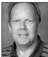
Lennart Grimsholm Duty Free, resor och produktbedömning